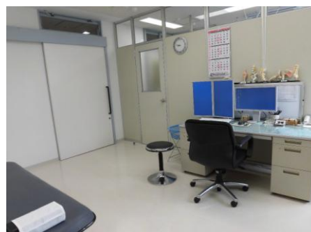
〈改装後の広々とした診察室〉