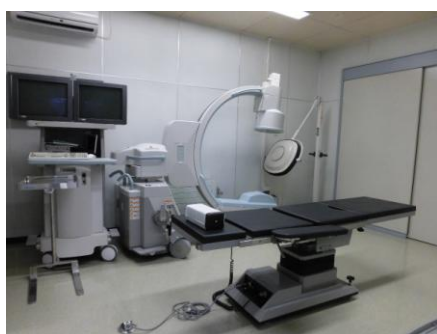
〈整備された処置室〉

仁友会の新しい一員として、また地域で必要とされるクリニックとしてよりよい医療を提供できるように努力してまいります。皆様どうぞ宜しくお願いいたします。